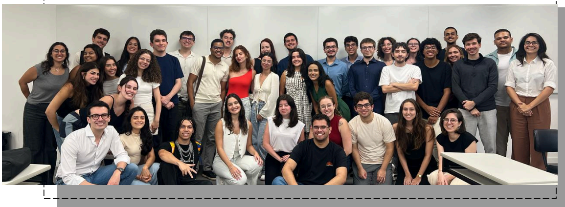
27ª e 28ª Turma da Escola de Formação Pública