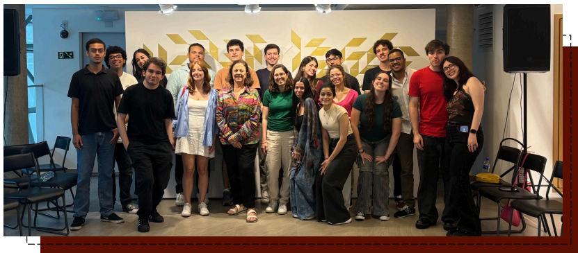
Visita ao Museu Judaico de São Paulo

O programa também conta com as chamadas Visitas de Formação . Nelas os alunos conhecem espaços que fomentam a reflexão jurídica e cultural , promovendo-se novas formas de enxergar o direito. Em 2025, os alunos conheceram o Museu das Favelas, o Museu Judaico de São Paulo, a Alesp e a Câmara dos Vereadores de São Paulo. Quer saber como foi? Confira os vídeos em nosso Instagram!